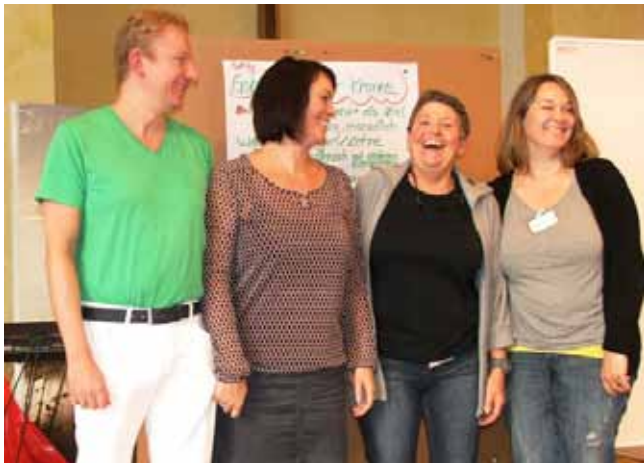
Das Leitungsteam der Zukunftskonferenz

130 Personen, Alte und Junge, langjährige Mitglieder und Freunde der Gemeinde waren dabei. Der Gottesdienstraum wurde freigeräumt und in ein großes Experimentierfeld verwandelt.