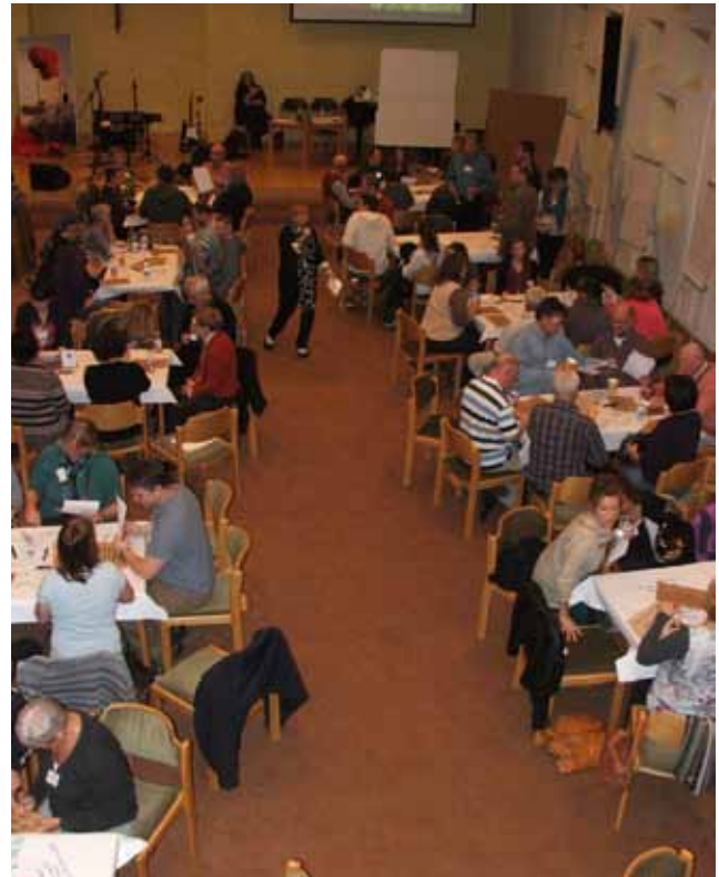
Konferenz im umfunktionierten Kirchenraum

Schon die Einstiegsfragen am Freitag hatten es in sich, z.B.: Wie würdest du einem Gast unseren Gottesdienst beschreiben? Was motiviert/demotiviert Mitarbeitende?