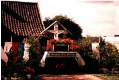
Kreuz an der Gartenstraße, Fronleichnam 1952 ehemals Schürmannshof

Besitzers Wert darauf legte, dass sich auch die nachfolgenden Generationen (inzwischen ist es die fünfte, die an der Gartenstraße 70 wohnt) um das Kreuz kümmern. Sollte das Haus je verkauft werden, müsse man nach Rücksprache mit der Stadt einen Aufstellplatz suchen oder es mitnehmen, erklärte mir Frau Kesseboom. Das vermutlich älteste Haus an der Gartenstraße ist ein ehemaliges Gesindehaus, das zum Hofkomplex Schürmann gehörte.