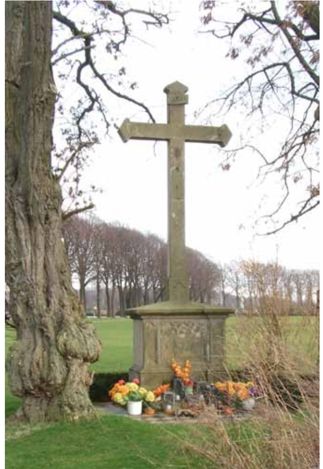
Kreuz in Bertlich, Rainweg