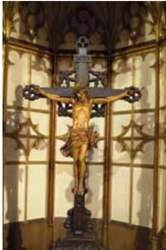
Kreuz in der St.-Josef-Kirche

Ein Bild des Kreuzes findet sich in den Distelner Chorfenstern aus der niederrheinischen Glasmalerei Derix. Dort ist es im mittleren, oberen Fenster abgebildet. Doch es gibt noch ein weiteres Kreuz, das nicht sofort ins Auge fällt, wenn man den Kirchenraum betritt. Und doch verbirgt es sich nicht, hat seinen Platz im Hochaltar, über sich die Figur des auferstandenen Christus, darunter den Tabernakel. Es ist umschlossen von einem hellen Raum, der – einer gotischen Apsis gleich – einen exponierten Standort bildet und wird zu beiden Seiten von Engeln flankiert. Das Kreuz stammt, wie der gesamte Hochaltar, vermutlich aus dem Jahr 1908. Die Informationen der Chronik lassen darauf schließen, dass beides vom Künstler Robert v. Lobenberg gearbeitet wurde, der im Raum Münster ansässig gewesen sein muss. Während weite Teile des hölzernen Hochaltars bemalt oder vergoldet sind, ist das Kreuz schlicht aus dunklem Holz gefertigt. Im Hintergrund sehen wir fein geschnitzte Ziselierungen, davor befindet sich der Korpus aus hellerem Holz. Um den sterbenden Christus genau betrachten zu