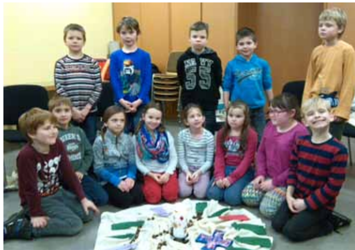
12 Kinder freuen sich auf die Erstkommunion in St. Joseph-Süd