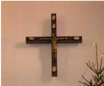
Auferstehungskreuz in der St.-Antonius-Kirche

te, sollte auch am Holze besiegt werden. Hierin ist der Baum im Paradies als Beginn der Beziehung zwischen Gott und Mensch festgehalten und der Vergleich bezieht sich auf die Vorstellung der Christen in der Antike. Sie sahen Christus als zweiten Adam, durch dessen Tod am Kreuz sie den Zugang zum Paradies zurückerhielten. In den Zügen des sterbenden Christus sind Leid und Schmerz allgegenwärtig.