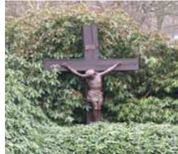
Kreuz auf Distelner Friedhof

ein neues, steinernes Kreuz. Darauf befinden sich Bilder aus dem Leben Jesu. Ganz links sieht man eine Krippenszene, in der Mitte Maria und Johannes