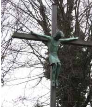
Kreuz am Paschenberg

In Herten gibt es darüber hinaus zahlreiche Wegekreuze, die oft mit bemerkenswerten Geschichten verbunden sind. Wenn wir sie heute passieren, tun wir das vielleicht nicht mit der Aufmerksamkeit, die ihnen noch vor wenigen Jahrzehnten entgegengebracht wurde. Doch sie laden weiterhin ein, einen Moment lang im Vorübergehen innezuhalten.