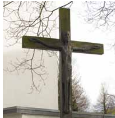
Kreuz Gartenstraße / Theodor-Heuss-Straße

KAB aufgestellt. Die Gemeinde St. Antonius ließ das überholungsbedürftige Kreuz abnehmen und restaurieren. Scheinbar war es aber den Menschen am Paschenberg wichtig geworden und so stellten Unbekannte innerhalb kürzester Zeit ein Metallkreuz dort auf. Dieses wurde später wieder gegen das restaurierte Holzkreuz ausgetauscht und eingelagert, da sich der Urheber nicht ermitteln ließ.