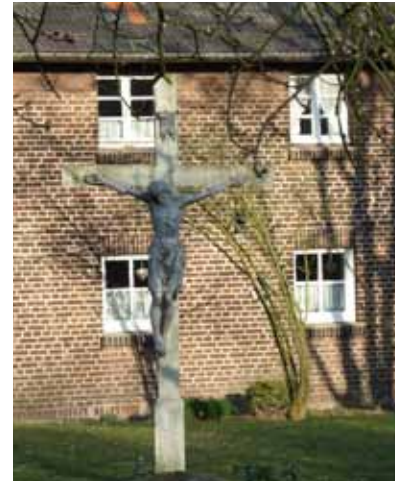
Kreuz Hof Sanders

Doch auch auf dem Weg Richtung Scherlebeck begegnet aufmerksamen Beobachtern seit einigen Jahren ein kleines