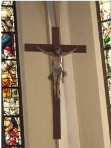
Das Kreuz in der St.-Joseph-Kirche, Süd