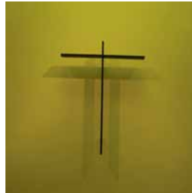
Kreuz in der St.-Barbara-Kirche

Es ist ein ganz schlichtes Kreuz, nur zwei Metallleisten, wobei die Querleiste etwas nach oben verschoben ist. Dadurch erhält es Proportionen, die dem menschlichen Körper mit ausgebreiteten Armen ähnlich sind.