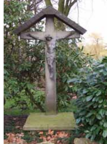
Kreuz Hof Godde

Auch das Kreuz auf dem alten Marpenhof (heute Hof Godde) zeugt von der engen Verbindung des Symbols in Leben und Tod. Seine Errichtung