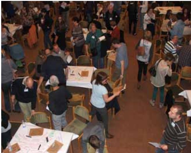
Wechsel der Gruppen

Am Samstag fanden sich die Gruppen je nach Mitarbeit und Interesse zusammen. Was läuft in „meinem“ Bereich gut, was nicht? Die Ergebnisse wurden auf einem „Marktplatz“ präsentiert. Die Senioren konnten den Teenagern die Schwerpunkte ihrer Arbeit erklären und die Jugendlichen der Gemeindeleitung ihre Sorgen mitteilen – kreuz und quer eben. Wir warfen auch einen Blick auf