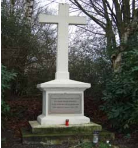
Kreuz auf der Backumer Straße