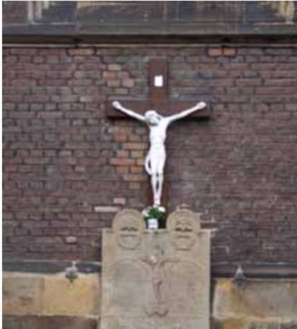
Peststein m. Kreuz und Inschrift St. Antonius, Herten-Mitte, Südseite

Text der Inschrift am Kreuz der St.-Antonius-Kirche: