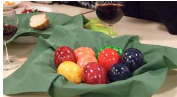
Agapefeier in St.-Joseph-Süd

So lange ich zurückdenken kann, findet auch im Patronat St. Joseph Süd nach der Ostermesse die Agapefeier im Pfarrheim statt. Die vom Patronatsausschuss liebevoll eingedeckten Tische laden selbst noch zu später Stunde zu Geselligkeit und zum Gespräch ein. Baguette und Wein gehören