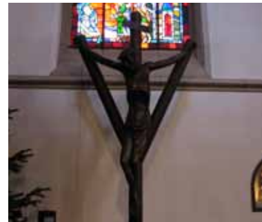
Coesfelder Kreuz in der St.-Antonius-Kirche

Anders ist es bei dem Coesfelder Kreuz in der St.-Antonius-Kirche. Schon beim Eintritt in den Kirchenraum durch das linke Seitenportal nähert sich der Besucher dem gekreuzigten Christus. Seinen Namen erhielt das gabelförmige Kruzifix von dem zu Beginn des 14. Jh. entstandenen Kreuz in der Coesfelder Lambertikirche. Um 1930 wurde die ebenso ausdrucksstarke Nachbildung vom Hertener Bernhard Gährken geschaffen. Das westfälische Gabelkreuz zeichnet sich durch die V-förmige Anbringung der seitlichen Balken aus, die vom mittleren Balken aus schräg hinaufführen. Oft bezeichnet man diese Kreuzform als Astkreuz, das den Erlösungsgedanken repräsentieren will,